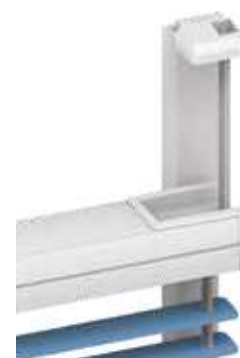
montaż przy pomocy profilu KL