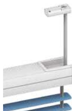
montaż przy pomocy stopek