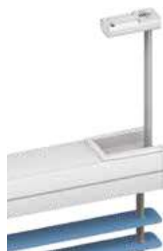
montaż przy pomocy stopek